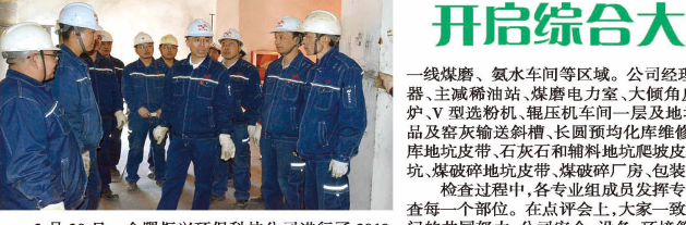
金隅振兴环保科技有限公司 开启综合大检查 吹响春季冲锋号

会议围绕求生存、谋发展开展了大讨论,并明确了目标定位。一是求生存。面对激烈的市场竞争和房地产市场持续低迷的形势,公司将天津旧楼改造项目、宝坻区新农村示范镇建设改造项目,全面开拓外地市场作为主要销售目标方向。公司产品销售将在去年开市旧楼改造项目所取得良好成绩的基础上,逐步扩展到天津市其它区域的旧楼改造项目,其工作重点放在河西项目及津南区;针对宝坻区新农村示范镇建设项目特点,面对市场的激烈竞争,打造适用的配套产品,借势历年在宝坻区的各